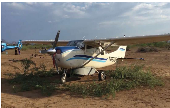
Notre avion après l'atterrissage d'urgence dans la vallée de Suguta. L'hélicoptère de secours nous a déjà trouvés !